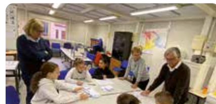
Vendredi 4 octobre : élections

également à des manifestations importantes telles que la Commémoration du 11 novembre ou encore la fête de Noël des Aînés.