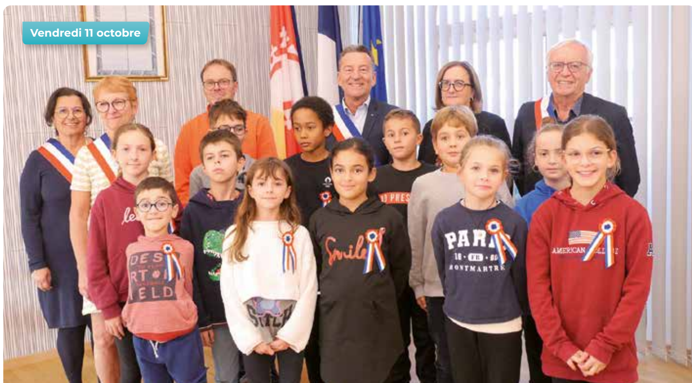
Vendredi 11 octobre