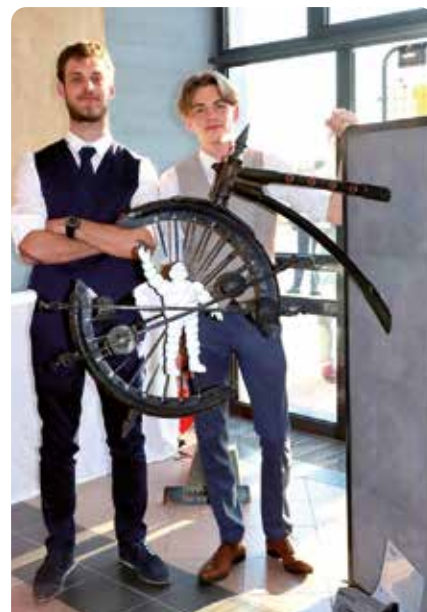
Les vainqueurs du concours de ferronnerie.

Et c'est le club local de basket qui s'est chargé de nourrir toutes ces personnes !