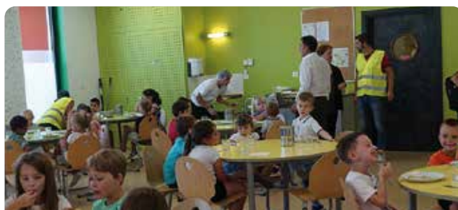
Accueil de Loisirs « Les Petits Loups »