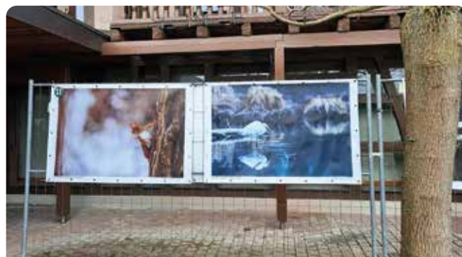
Exposition de la réserve de Rhinau