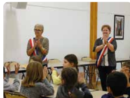
13 octobre : installation