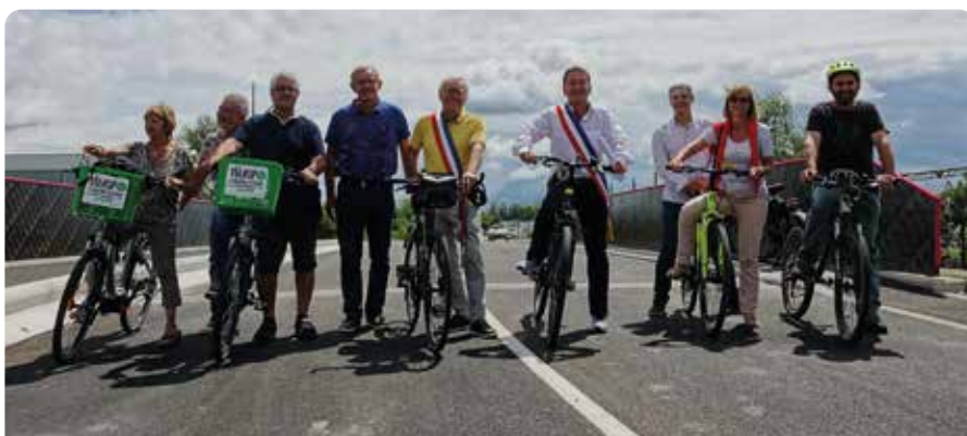
Réouverture du Pont