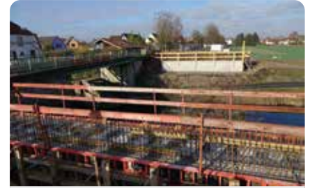
Pont du Tramway