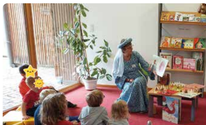
Rendez-vous contes spécial « Médiévales »