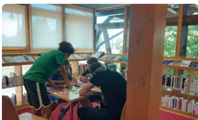
Atelier Escape Game