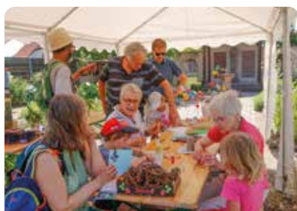
Rendez-vous aux jardins, l'atelier des enfants

...Et bienvenue aux futurs adhérents en 2023 !