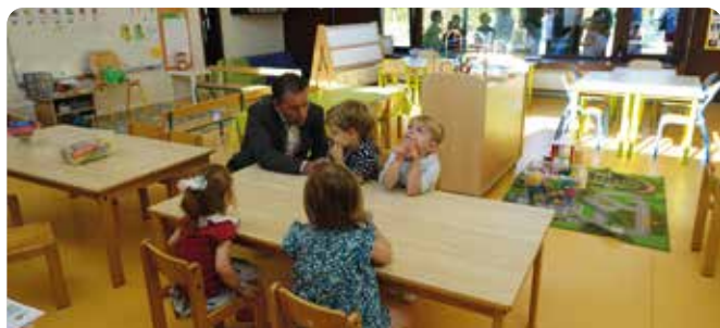
École maternelle « La Clé des Champs »