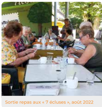
Sortie repas aux « 7 écluses », août 2022