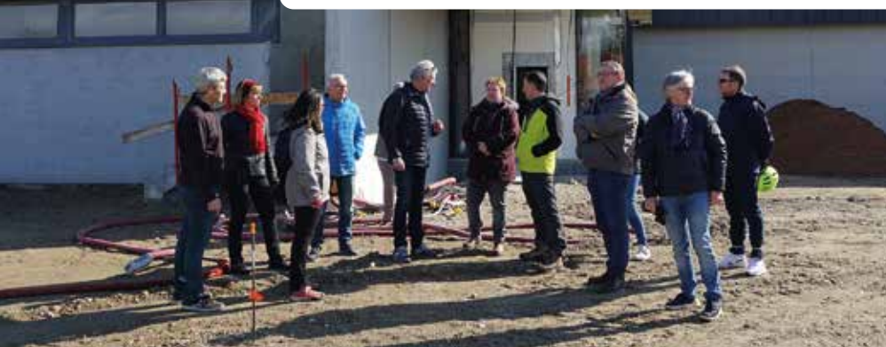
Schéma directeur d'assainissement

La nouvelle plateforme qui accueillera les futurs terrains de pétanque est terrassée.