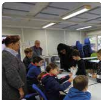
10 octobre : élections