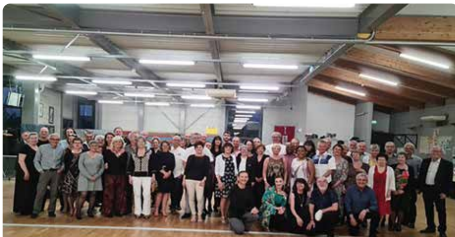
30 avril - Soirée dansante de Printemps

2022, une année dynamique pour le Club de Danse :