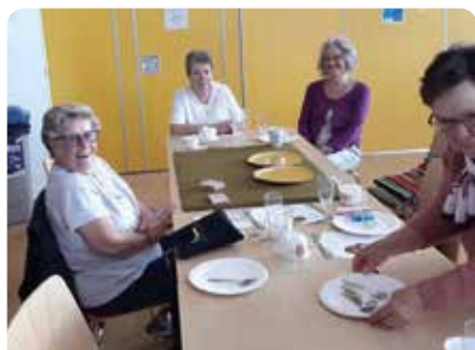
Rencontres tous les mardis, de 14 h à 17 h au Centre Camille Claus (1 er étage avec ascenseur)