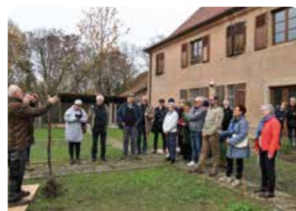
Plantation des premiers fruitiers au verger