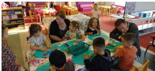
École maternelle « Les Hirondelles »