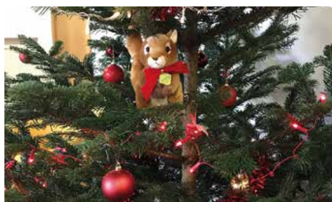
Atelier Brico de Noël