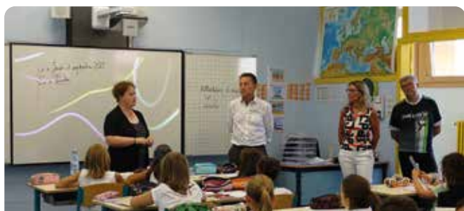
École élémentaire « L'Île Aux Frênes »