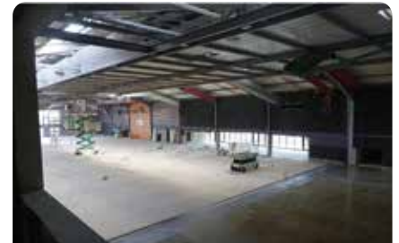
Centre Camille Claus