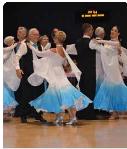
11 juin - Bal de fin de saison