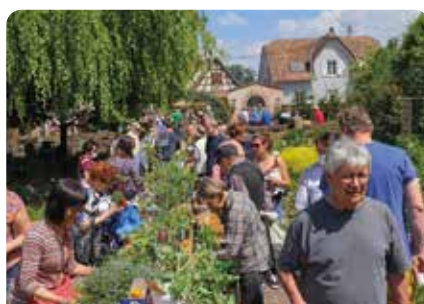
Troc de plantes du printemps