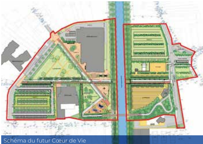
Schéma du futur Cœur de Vie

Une cinquantaine de terrains et un club house neuf pour le club de pétanque, un city stade et un espace de regroupement sécurisé pour nos ados, un espace de jeu mixte en pratique libre désenclaveront l'actuel tennis club et feront de ce lieu une plaine de jeu appréciée de tous.