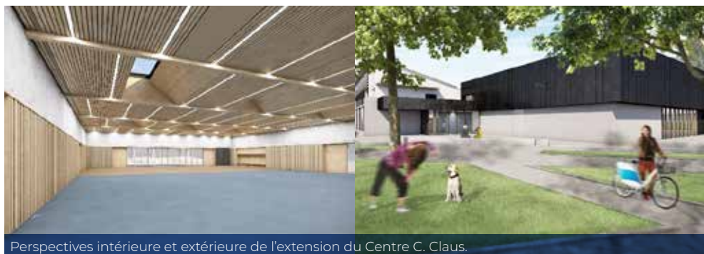
Perspectives intérieure et extérieure de l'extension du Centre C. Claus.

En agrandissant le Centre Camille Claus, la municipalité répond à des besoins qualitatifs et quantitatifs liés au développement associatif mais aussi scolaire. Ainsi, l'objectif est de rendre le bâtiment plus polyvalent aussi bien pour la pratique sportive et culturelle, que pour les activités des élèves de nos écoles.