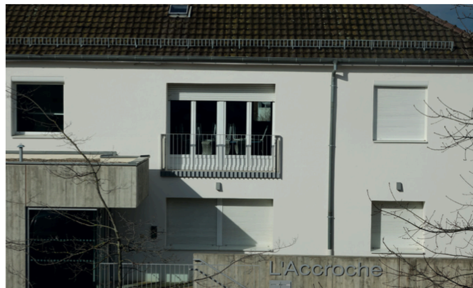
L'Accroche > 60 rue de la 1ère Division Blindée à Eschau (situé à l'arrière de la Mairie)